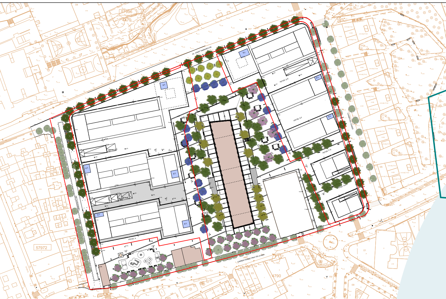
Proyecto de urbanización Cosme toda - Plano de la planta de urbanización (Fase I & II) La información gráfica (plano) que se incorpora al díptico forma parte de la documentación gráfica del proyecto de urbanización del sector en el que se encuentra la promoción, aprobado por el Ayuntamiento de L'Hospitalet de Llobregat, no siendo responsable el Promotor [*].

Entre aquests elements, destaquen diversos forns, estructures i galeries subterrànies, dos xemeneies i tres edificis que són patrimoni municipal. L'Ajuntament ja treballa en la musealització dels forns i un dels edificis, el més gran de tots, conegut amb el nom de Puig i Gairalt, possiblement es destinarà a finalitats culturals, però encara no està confirmat.